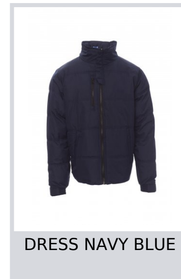
DRESS NAVY BLUE